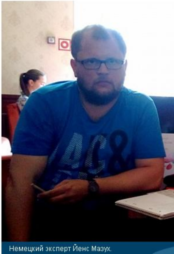
Немецкий эксперт Йенс Мазух.